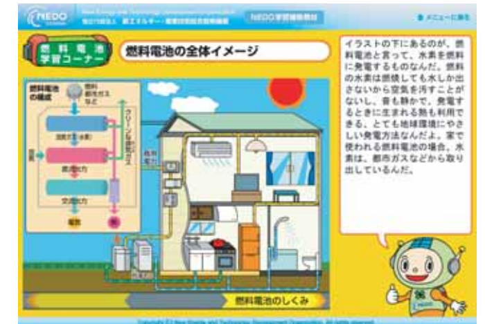
NEDO 技術開発機構 新エネルギー学習教材 「太陽光発電・燃料電池編」より

大型モニターで館内設備の説明のほか、稚内新エネルギー研究会の紹介、地球温暖化問題などの解説を見ることができます。また、ウェブやNEDO技術開発機構の新エネルギー学習教材「太陽光発電・燃料電池の？を！にする旅」で新エネルギーについて学習できます。